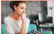
EXZESSE DES ALLTAGS